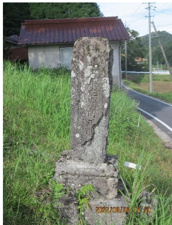
八反田（中垣宅付近）