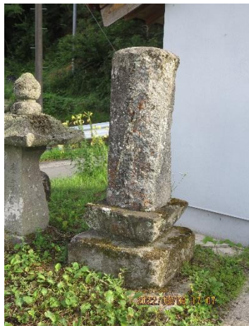
山田（分別収集所付近）