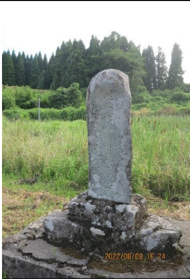
四日市（梨木宅付近）