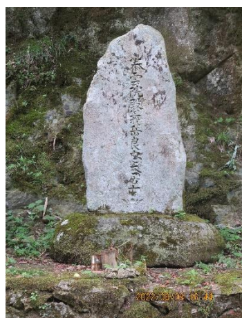
川上（鳴ヶ鼻橋付近）