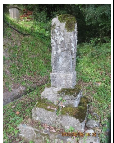
椿（八重山神社跡付近）